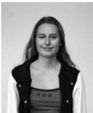
ELISE DELA FOTOGRAF