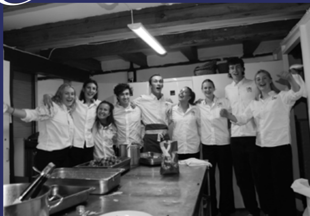
De tappra sexmästarna och deras jobbarlag under 95-års jubileumets sittning