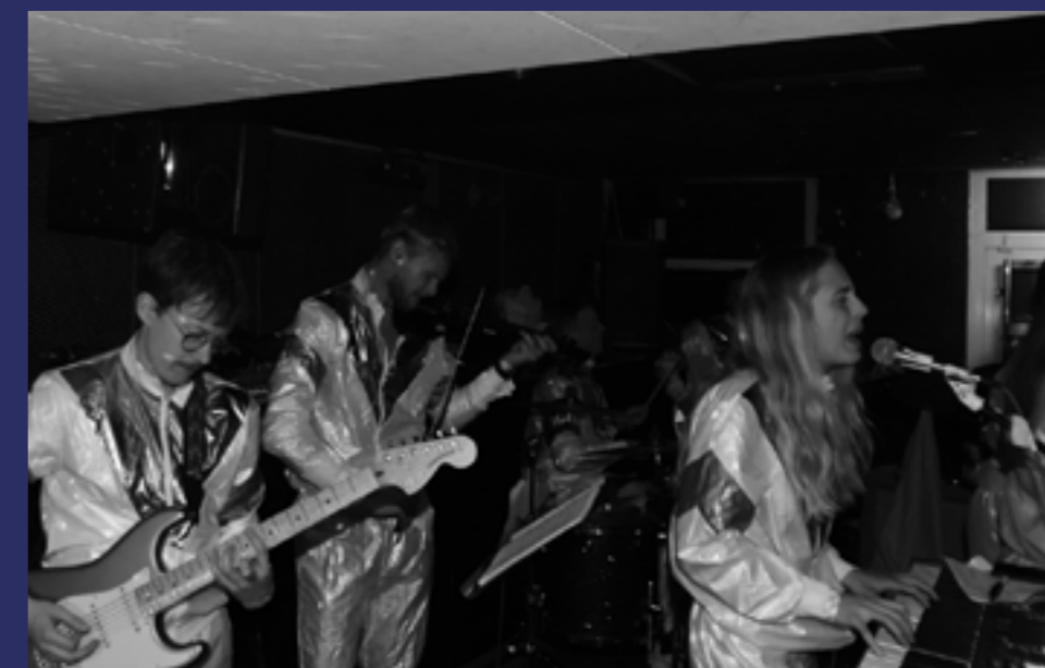
Hallands Nations Husband under deras spelning på eftersläppet