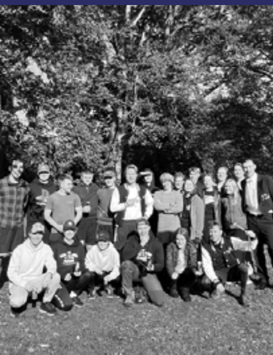
Stangstörtarna på de traditionsenliga Hedvigspelen

I motsats till den allmänna uppfattningen så gick startskottet för jubileumskvällen inte på kvällen. På morgonkvisten samlades nämligen en tapper skara hallänningar i Tunaparken för att tävla i en svettig femkamp: Hedvigspelen! Grenarna bestod av stangstörtning, dragkamp, norsk julafton, spikduell och avslutningsvis en säcklöpning. En stor eloge ska riktas till nationens spårtekniker och deras funktionärer som anordnade spelen. I sann spårtekniker anda var de såklart upplådda i frack. Tyvärr verkar ingen ha något minne av vem som vann själva spelen, men spårteknikerna hälsar att alla lag gjorde bra ifrån sig!